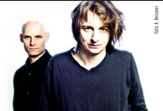
Klavier-Winter Bad Gandersheim

VV-Karten nur in Bad Gandersheim (Buchhandlung Pieper), Northeim (Papierus) und Göttingen (TonKost, Vaternahm) erhältlich!