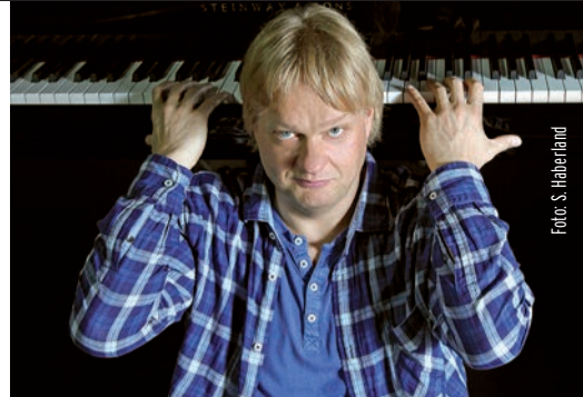
Klavier-Winter Bad Gandersheim

VV-Karten nur in Bad Gandersheim (Buchhandlung Pieper), Northeim (Papierus) und Göttingen (TonKost, Vaternahm) erhältlich!