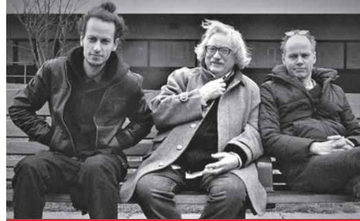
Klavier-Winter Bad Gandersheim

VV-Karten nur in Bad Gandersheim (Buchhandlung Pieper), Northeim (Papierus) und Göttingen (TonKost, Vaternahm) erhältlich!